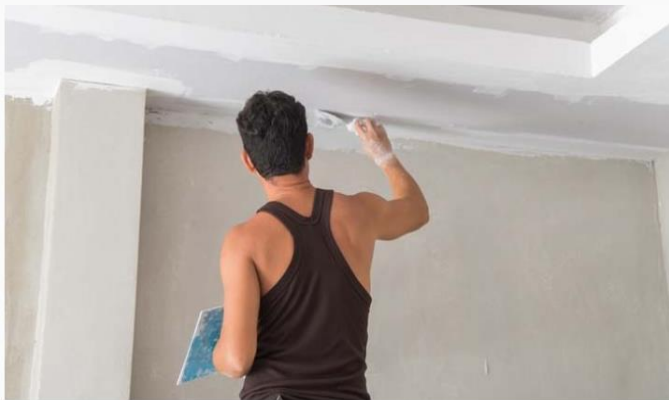
UREGISTRERT: Firmaer som ikke er registrert tar jobben fra de seriøse.