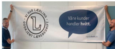
Fjogstad-Hus viser stoff fra banneren sosiale.medie/